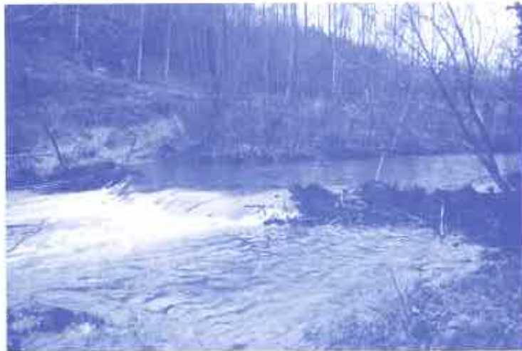
Barrage de castors sur la Lienne, décembre 2009.

Fin septembre le barrage d'environ un mètre de haut et 2 à 3 mètres de large, coupait complètement la rivière. Mais les pluies et les crues de novembre l'ont partiellement ouvert (voir photo).