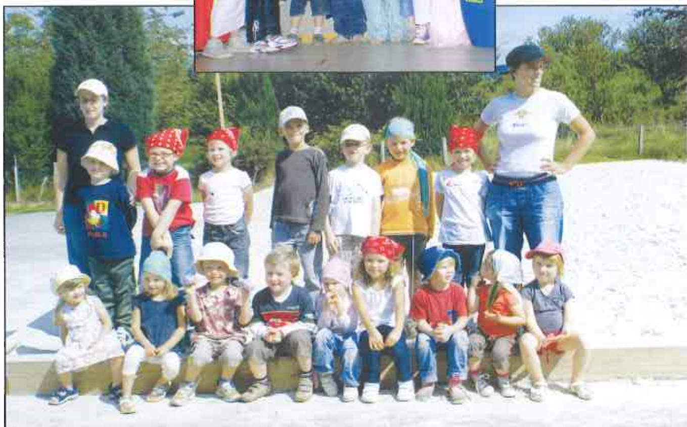
Plaines de vacances à Rahier ( Lire article page 22)