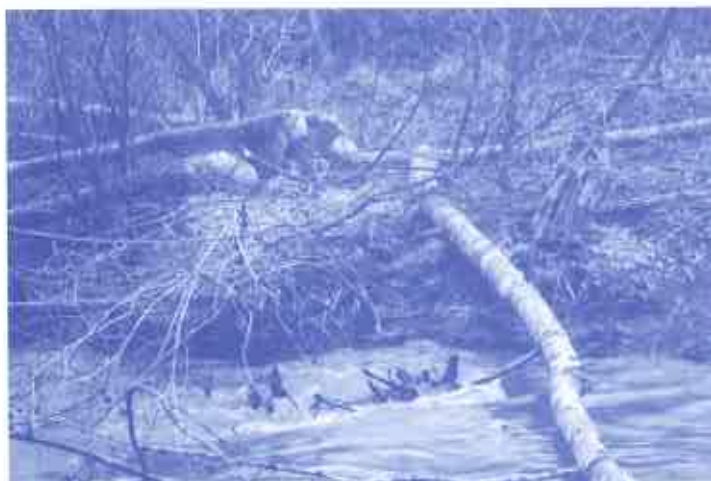
Arbres rongés et abattus par les castors sur la Lienne, décembre 2009

Les traces d'activité des castors sont toujours bien visibles en amont du barrage : deux huttes sont régulièrement recouvertes de branches, de feuilles et de terre, les arbres sont rongés et abattus (voir photo), les « sentiers-glissades » qui aboutissent dans l'eau sont très utilisés. Malheureusement, les castors sont rarement observés directement : ils sont actifs à partir du crépuscule ou au petit matin et disparaissent sous l'eau ou dans leur hutte au moindre dérangement.