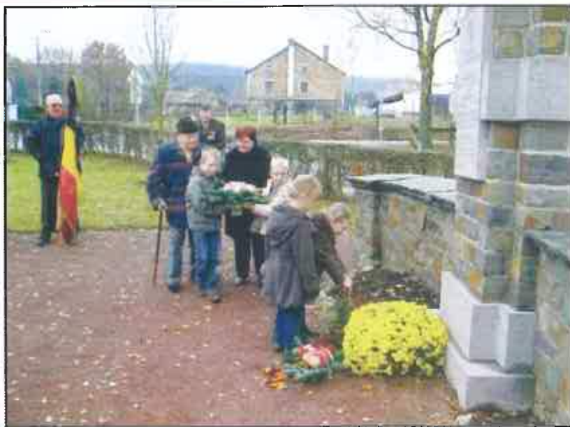
Cérémonie de dépôt de fleurs à Chevron le 11 novembre (lire page 21)